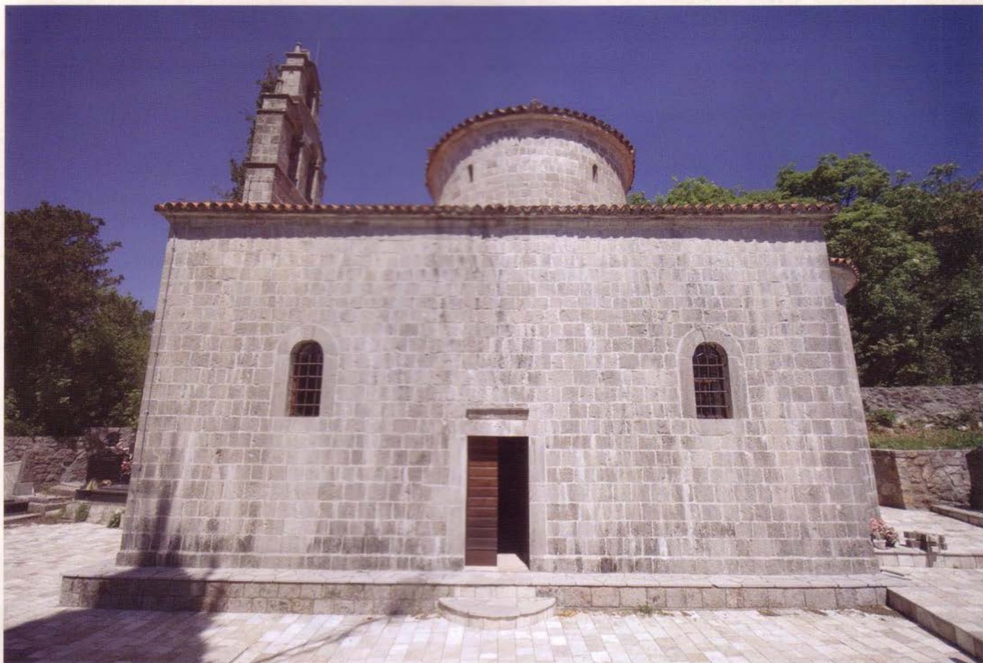
Црква Светог Николе, након обнове 2011. године