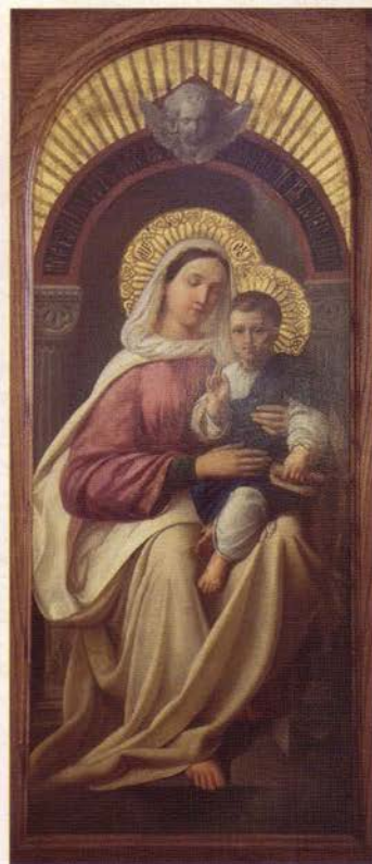
Богородица са Христом, иконостас, 1898. година

На лијевим, бочним дверима представљена су двојна попрсја јеванђелиста Св. Јована и Св. Луке, а на десним Св. Марка и Св. Матеја.