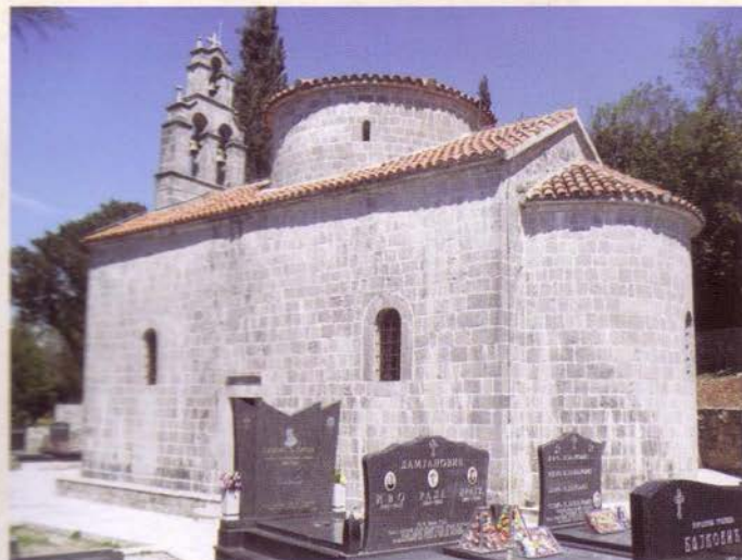
Црква Светог Николе после обнове, 2011. године

У средишту прве зоне налазе се Царске двери са уобичајеном представом Благовијести које чине иконе са попрсјима Св. Арханђела Гаврила и Богородице.