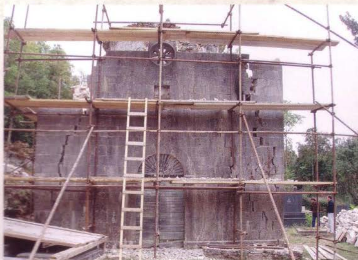
Црква Светог Николе, прочеље, у току обнове (2001 – 2011)