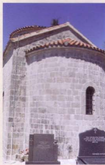
Детаљ са апсидом, послје обнове 2011. године