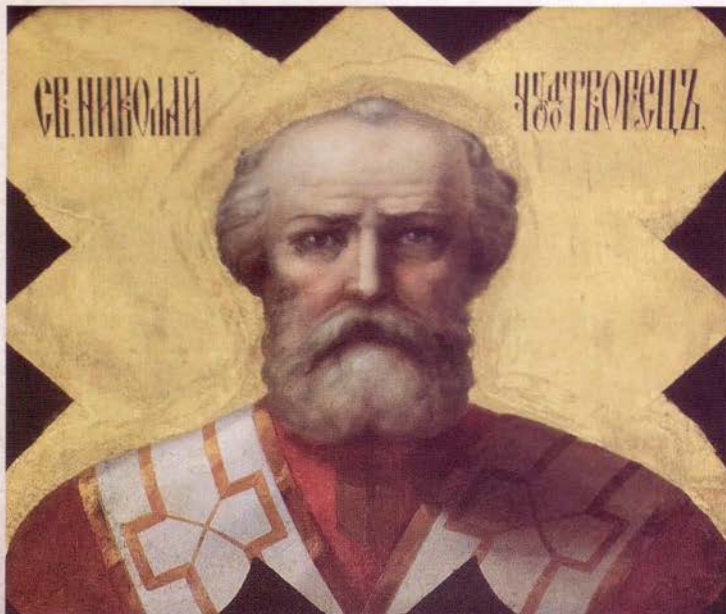
Икона Светог Николе са иконостаса цркве Светог Николе, Главати, 1898. година