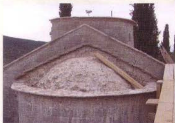
Кровна конструкција апсиде, у току обнове (2001 – 2011)