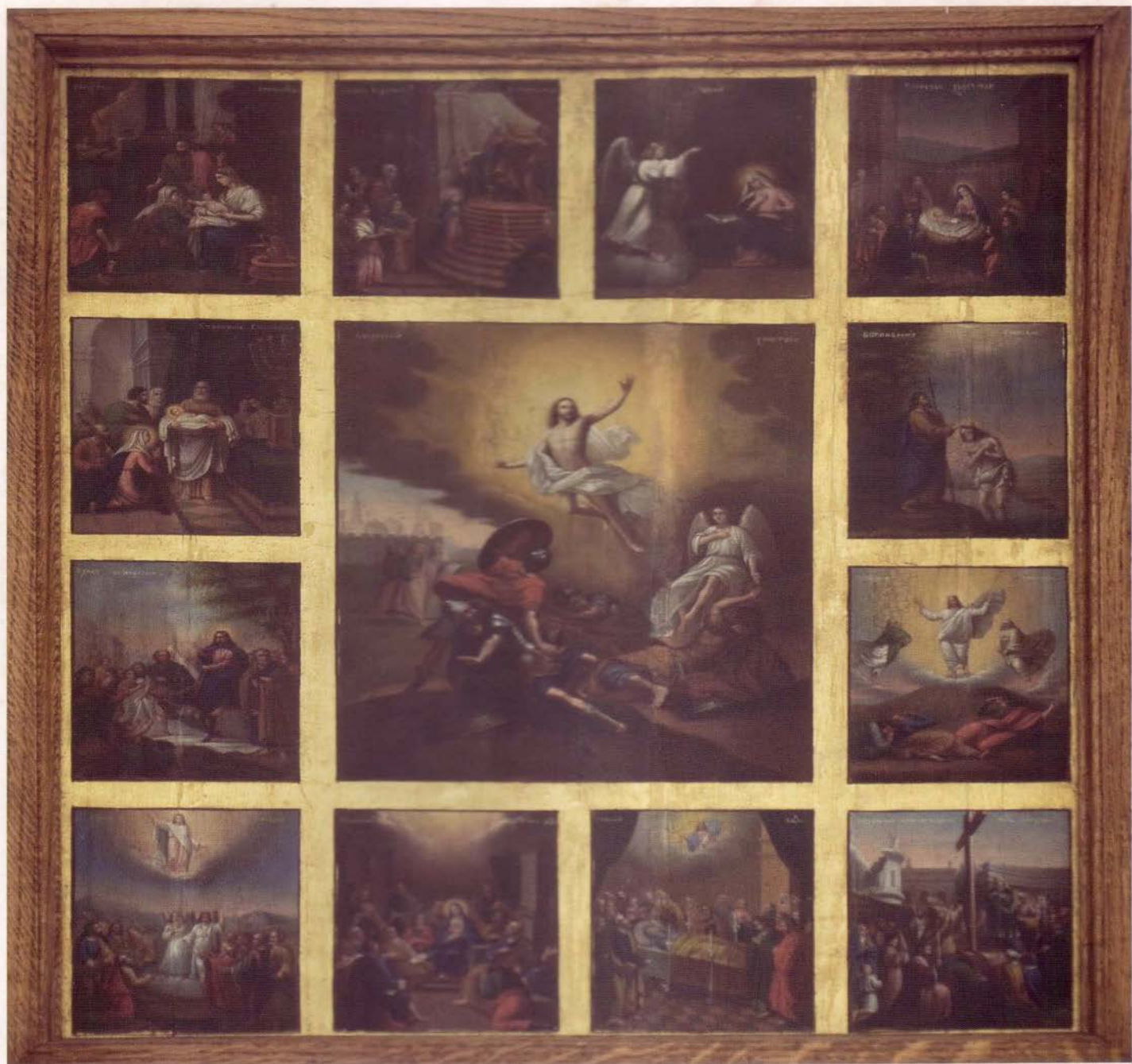
Икона Васкресења Господњег са представама из живота Христа и Богородице, иконостас, 1898. година