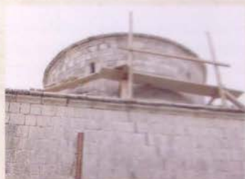
Детаљ са куполом, у току обнове (2001 – 2011)