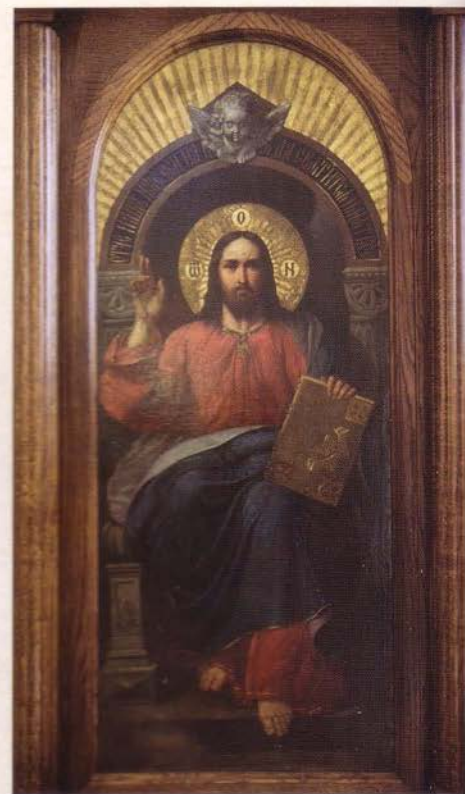
Христос, иконостас, 1898. година

Десно од централне иконе налази се икона са представом Св. Павла у цијелој, стојећој фигури, док се поред ње налазе, симетрично са лијевој страном, једна изнад друге, четвртасте иконе са попрсјима-портретима Св. Александра Невског и Св. Марије Магдалене.