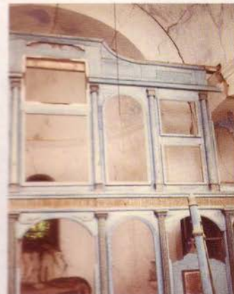
Детаљ ентеријера са оштећеном иконостасном преградом