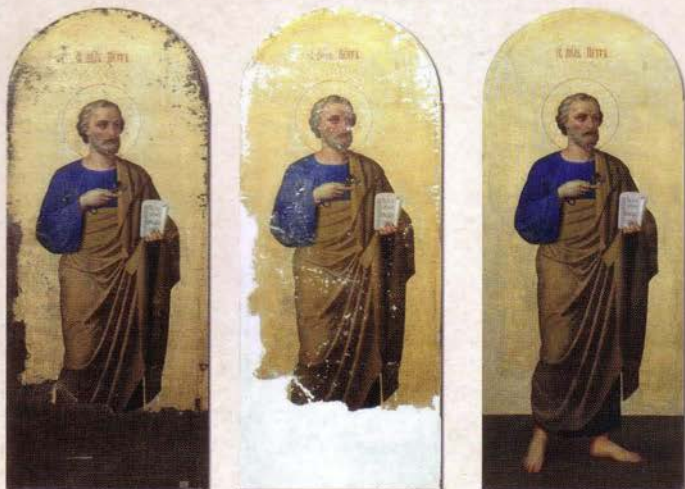
Прије конзервације У току конзервације Послије конзервације Икона Светог Петра, иконостас

Лијево од ове иконе налази се икона са представом Св. Петра у цијелој, стојећој фигури, а поред њега, једна изнад друге, четвртасте иконе са попрсјима-портретима Св. царице Јелене и Св. Николе.