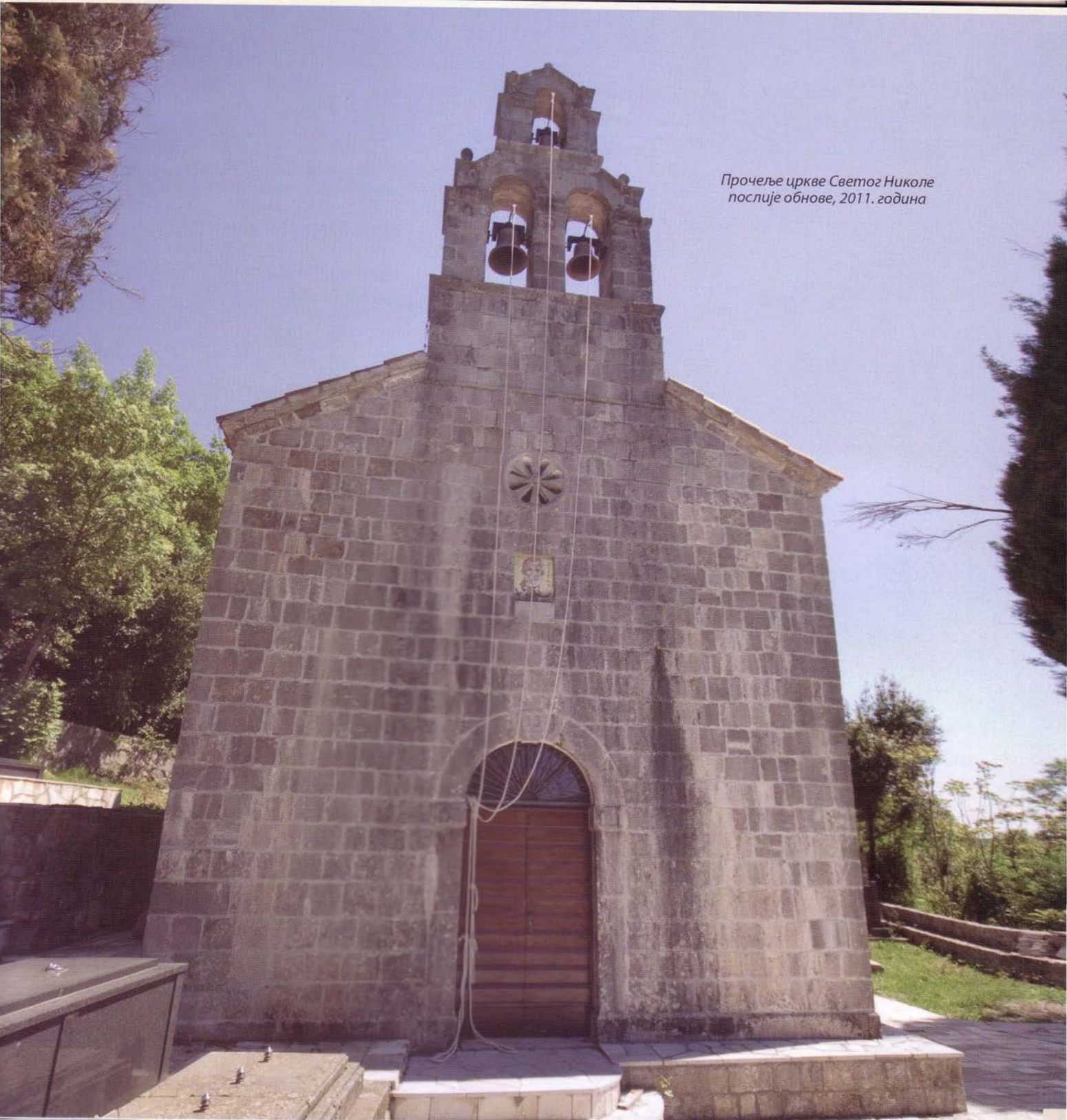
Прочеље цркве Светог Николе послије обнове, 2011. година