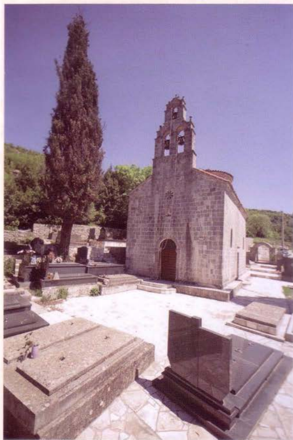
Црква Светог Николе, након обнове 2011. године

Смјештено у приобалном, крајње источном дијелу Доњег Грбља, које према Будви граничи плажама Јаз и Трстено, Главати представљају типично приморско село, збијеног типа, а припада петоселици коју чине још и села: Загора, Вишњево, Кримовице и Ковачи.