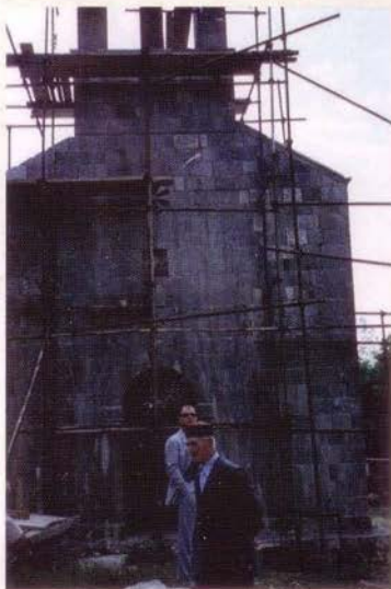
Прочеље, у току обнове