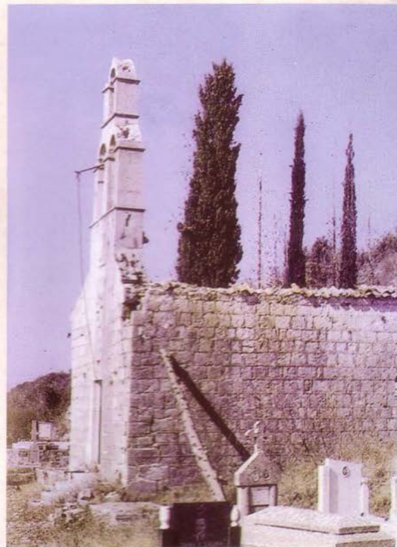
Црква Светог Ђорђа – Главати, Доњи Грбљ

„Стара школа“, касније „Задруга“, свједочи о првим облицима удруженог задругарства и оснивања штедионице која је служила за кредитирање домаћинстава са циљем унапређења и осавременивања земљорадње. То је подразумијевало набавку расне стоке, квалитетнијих садница маслине, воћака и винове лозе, као и алата и оруђа за рад.