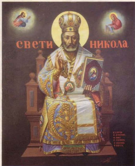
Икона Светог Николе, црква Светог Николе, 1897. године