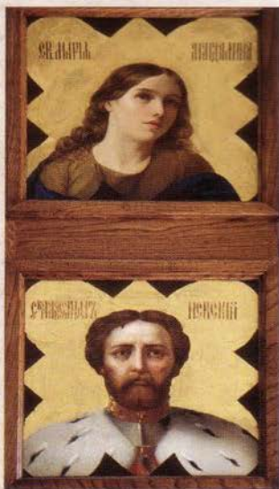
Иконе са представом Светог Александра Невског и Свете Марије Магдалене, 1898. година

Десно од централне иконе налази се икона са представом Св. Павла у цијелој, стојећој фигури, док се поред ње налазе, симетрично са лијевој страном, једна изнад друге, четвртасте иконе са попрсјима-портретима Св. Александра Невског и Св. Марије Магдалене.