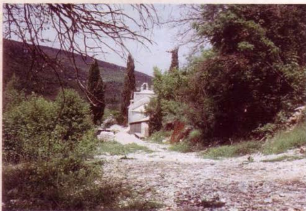
Црква Светог Николе – Главати, Доњи Грбљ

На „Савиној Главици“, поред цркве, још су се налазиле „Стара школа“ (1850 – 1910) и „Нова школа“ (1910 – 1979).