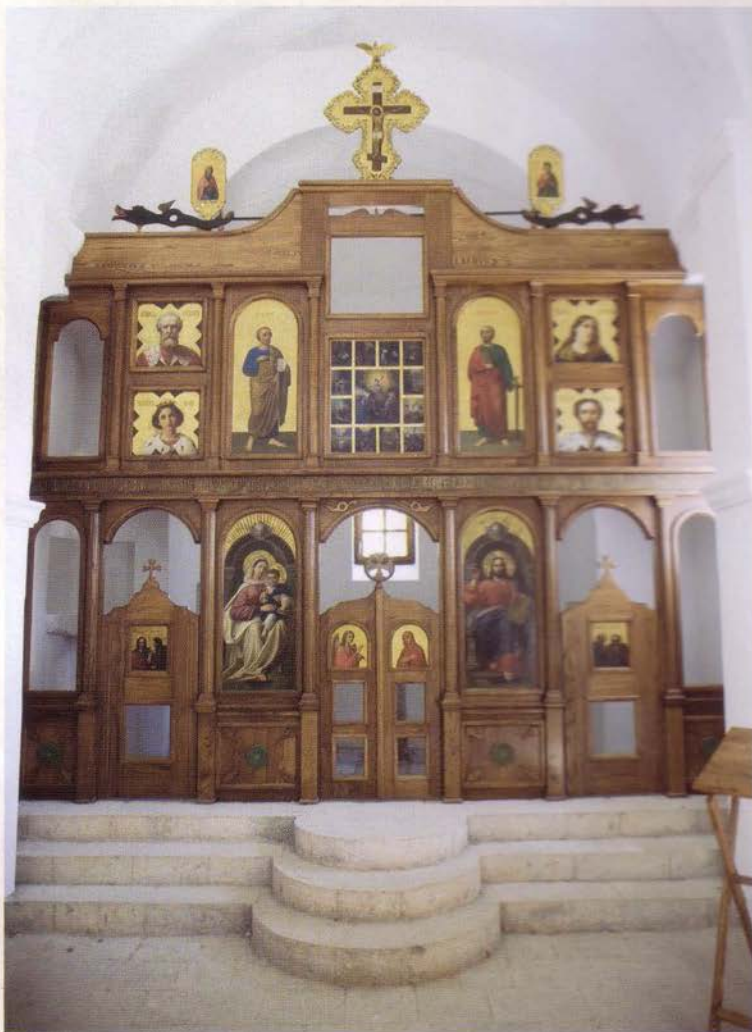
Ентеријер цркве Светог Николе, иконостас, 1898. година