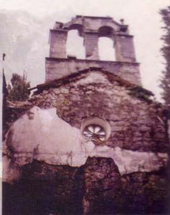
Прочеље, послје земљотреса