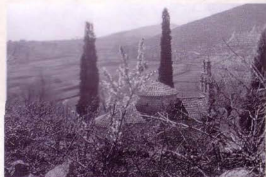
Црква Светог Николе, прије земљотреса 1979. године