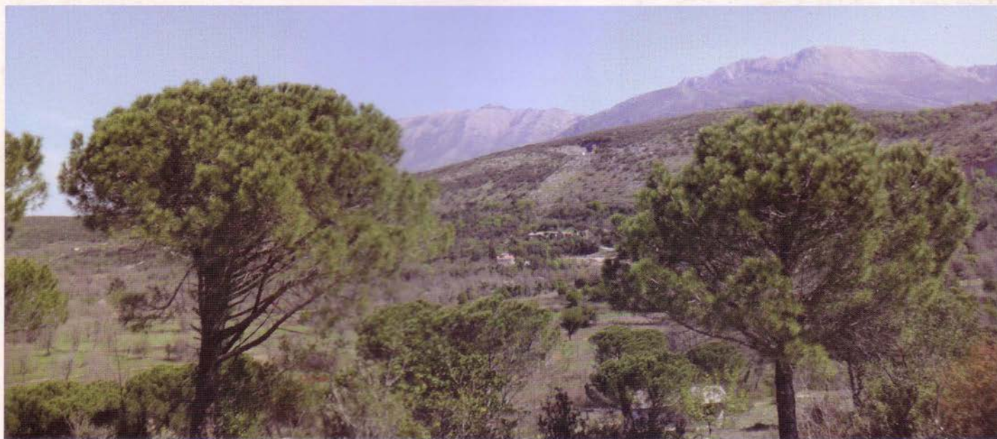
Село Главати са црквом Светог Николе, Доњи Грбаљ

На дан Преноса моштију Св. Николе (Прољећни Никољдан)